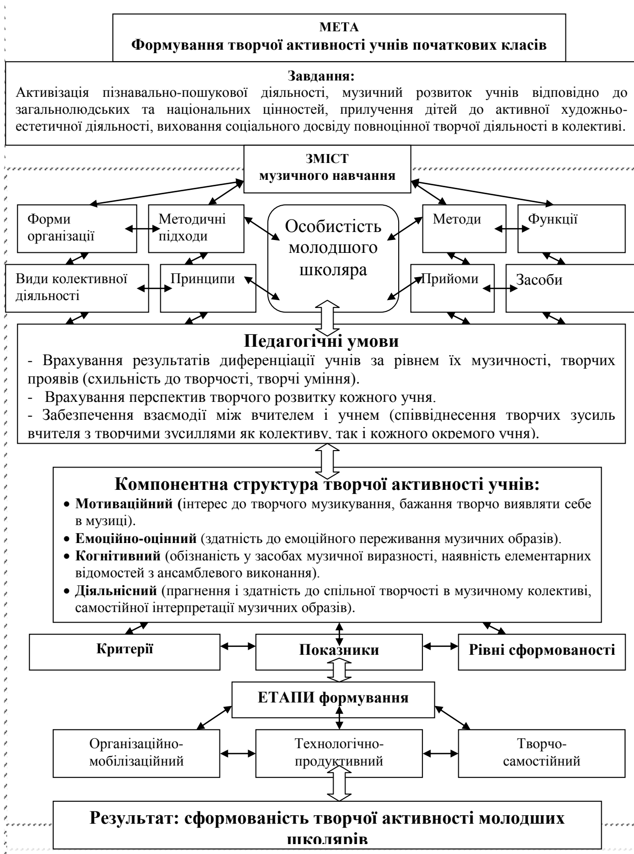
Рис.1 Методична модель формування творчої активності молодших школярів засобами колективної музичної діяльності