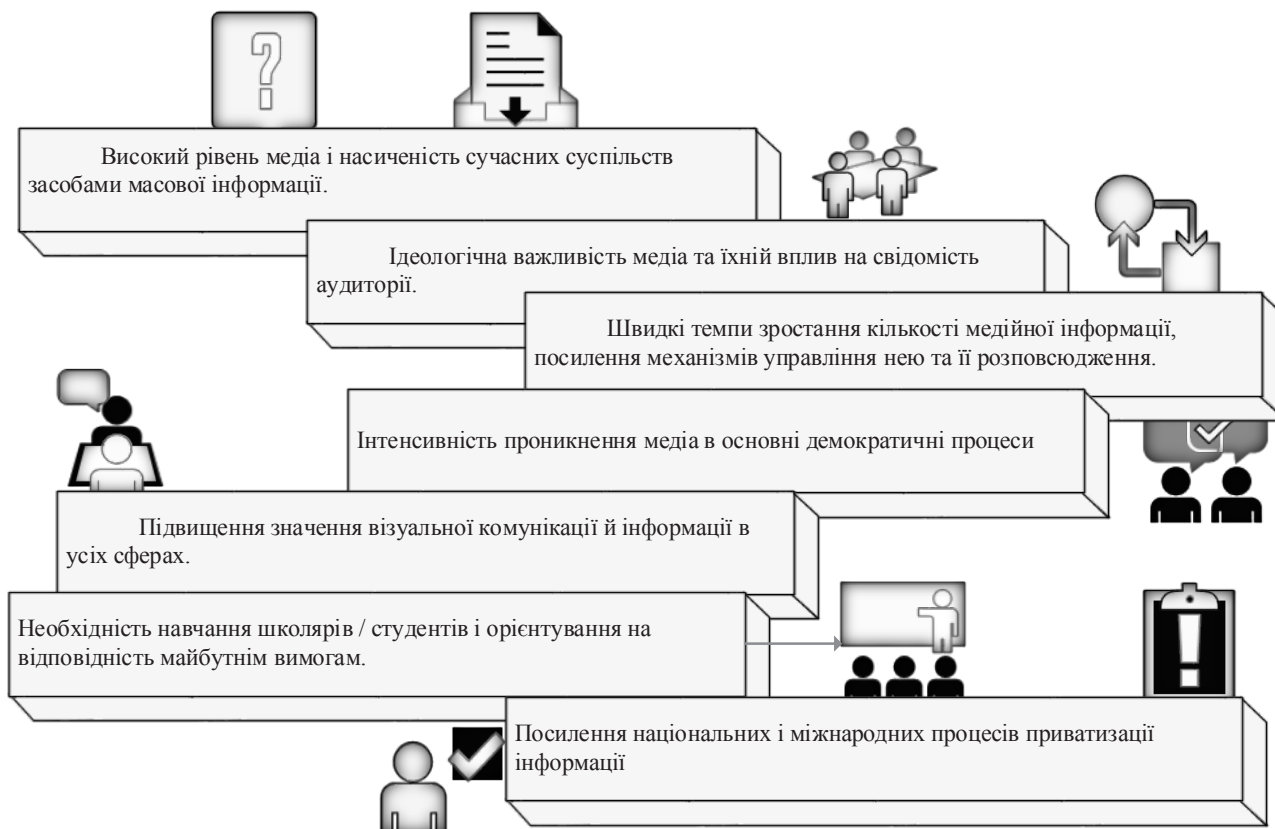
Рис. 1. Причини пріоритетності й актуальності медіаосвіти

Джерело розроблено автором за даними джерела [5]