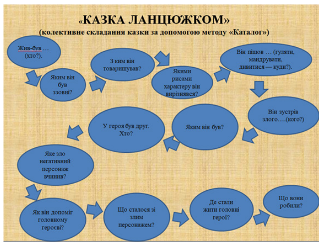
Рис. 5. Гра «Казка ланцюжком»

Тренер: Можете запропонувати батькам пограти гру (рис. 5).