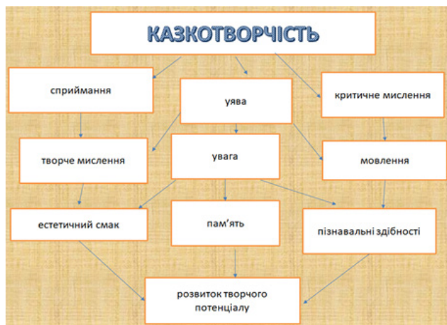
Рис. 1. Інтелект-карта «Казкотворчість»

Тренер: Сьогодні ми з вами дамо відповіді на такі запитання: Смісл казкотворення? Сутність педагогіки партнерства у закладі дошкільної освіти. Як ми працюємо з казкою в системі «вихователь–дитина–батьки»? Прошу вас відповісти на ці запитання і з відповідей створити інтелект-карту «Казкотворчість» (колективне обговорення; рис. 1).