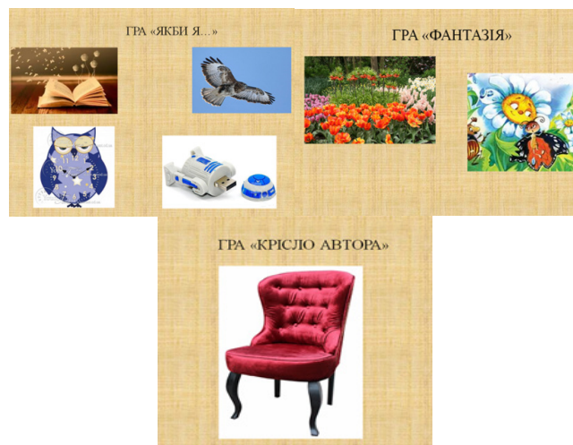
Рис. 7. Варіанти ігор

Тренер: У роботі з дітьми пропоную використовувати такі ігри (рис. 7).