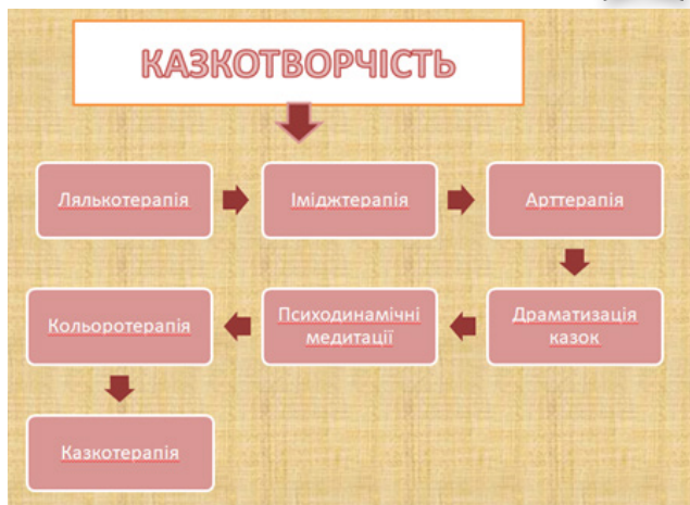
Рис. 2. Техніки казкотворчості

Причому можливості різноманітних технік казкотворчості виявляються в тому, що вони: суттєво формують «моральний імунітет» людини; активують діяльність обох півкуль мозку та відповідних генетичних рівнів; розширюють можливості самопізнання; удосконалюють розвиток енергопотенціалу, чуттєвості, психомоторики, мислення й уяви; забезпечують гармонійний розвиток особистості, душі і духу, що на певному життєвому етапі проявляється мовою казки.