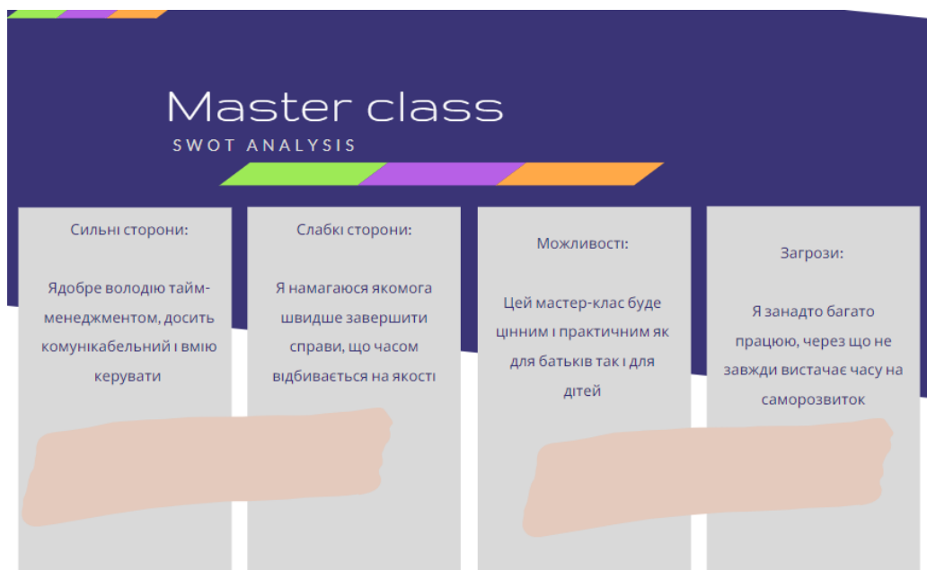
Рис. 1. Матриця SWOT майстер-класу

У полі «завдання» для кожного пункту завдань розглядаються всі необхідні кроки для їх виконання. Тут для кожного кроку необхідно прорахувати часовий відрізок, ураховуючи склад учасників майстер-класу.