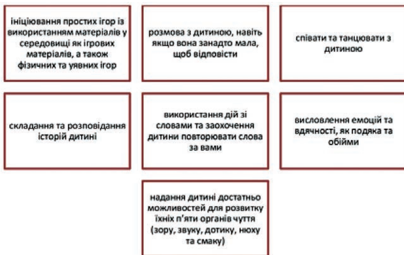
Рис. 2. Шляхи залучення дітей до спілкування в іграх

Тим не менш, важливо зазначити, що дошкільнята потребують соціалізації, що виступає ключовим етапом їх розвитку. Дослідження (В. Бочарова, Т. Василькова, Ю. Василькова, І. Зверева, Л. Коваль, К. Крутій, А. Мудрик та ін.) показують, що коли діти не мають можливості гратися на природі, у них підвищений ризик проблем із увагою та поведінкою. Без гри діти не мають можливості розтягнути свою увагу та набути навичок,