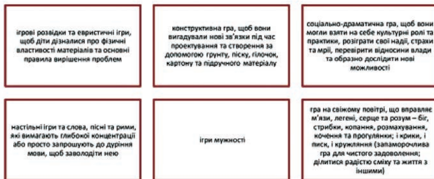
Рис. 5. Види гри

Узагальнення вищезазначеного дозволяє стверджувати, що ігрова діяльність у творчому розвитку дитини дітей дошкільного віку визначається як внутрішньо мотивований, автономний та інтерактивний процес, який сприяє демократичній участі та співпраці, імпровізації, сприйняттю, ризику, множинності ідентичності, творчого й індивідуального мислення, що може бути легко відтворений у різних культурах, різних вікових групах, а також за високих і низьких ресурсів навколишнього середовища.