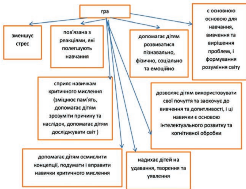
Рис. 1. Переваги ігрової діяльності дітей

Для того, щоб діти стали співпрацювати у грі потрібно починаючи з раннього віку при